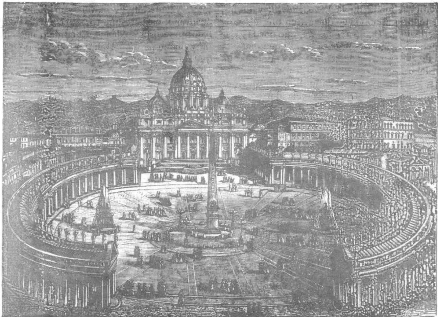
Frente a la basílica de San Pedro, en Roma, la espaciosa Plaza es ceñida por la columnata de Bemini, cuyos brazos abiertos recuerdan al mundo la misión encomendada a ella por su Divino Fundador Jesucristo de reunir a todos los hombres en bien de su salvación.